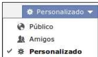
Ilustración 4: Opciones de visibilidad para el contenido que compartes

Hay otro tipo de información que es la que tu DECIDES hacer pública, y es la información que compartes en cada actualización de estado, foto que subes, publicación que compartes, etc. Puedes elegir entre hacerla visible de manera pública, sólo a tus amigos o personalizarla a través del uso de Listas o seleccionando de manera manual, qué usuarios pueden y qué usuarios no pueden ver esa publicación.