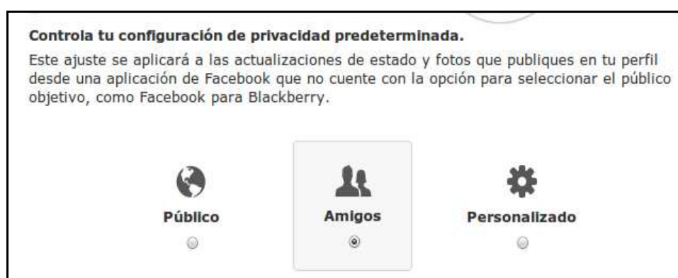
Ilustración 5: Tipo de configuración de la privacidad predeterminada

En “ Cuenta ” > “ Configuración de la privacidad ” puedes ajustar tu configuración de privacidad predeterminada para que por defecto cualquier actualización de estado o foto que publiques en tu muro solo sea visible para esa privacidad determinada que elijas. Puedes escoger que tus publicaciones las pueda ver todo Internet (Público), sólo tus Amigos o hacer una personalización a través del uso de Listas .