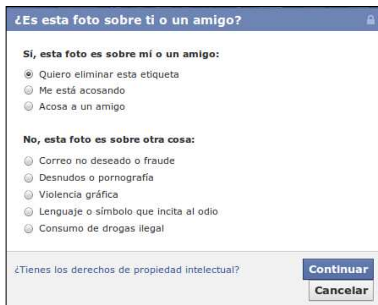
Ilustración 7: Opciones de Reportar/Eliminar etiqueta

Si encuentras un contenido que creas que puede ser ofensivo (una imagen, una página, etc.) puedes denunciarlo haciendo clic en el enlace “ Denunciar ” o “ Reportar ” que aparece junto a dicha publicación. Si encuentras una foto en la que apareces, te han etiquetado o refleja un contenido ofensivo, puedes hacer clic en el botón de “ Reportar/Eliminar ” etiqueta donde podrás realizar cualquiera de las opciones que quedan reflejadas en la siguiente imagen: